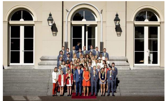
Huldiging bij Koning Willem-Alexander en Koningin Maxima

Normaal hebben we 2/3 weken vakantie elk jaar, maar nu heb ik ongeveer twee maanden vrij genomen. Ik ben samen met mijn vriendin aan het rondreizen in Zuid-Amerika en neem even afstand van het roeien. Allicht dat ik volgend jaar naar de Wereldkampioenschappen in Florida ga, maar dat moet ik nog allemaal even bekijken. Eerst even bijkomen!