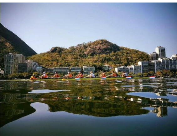
Trainen in Rio

De Olympische Spelen waren geweldig. Het was voor mij de eerste keer. Het is zo mooi om samen te komen met de beste atleten van de wereld en te weten dat iedereen er keihard voor heeft getraind. Dat geeft een speciaal gevoel.