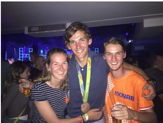
Op de huldiging met zijn zusje en broertje, ook leerlingen geweest van Het Amsterdams Lyceum!