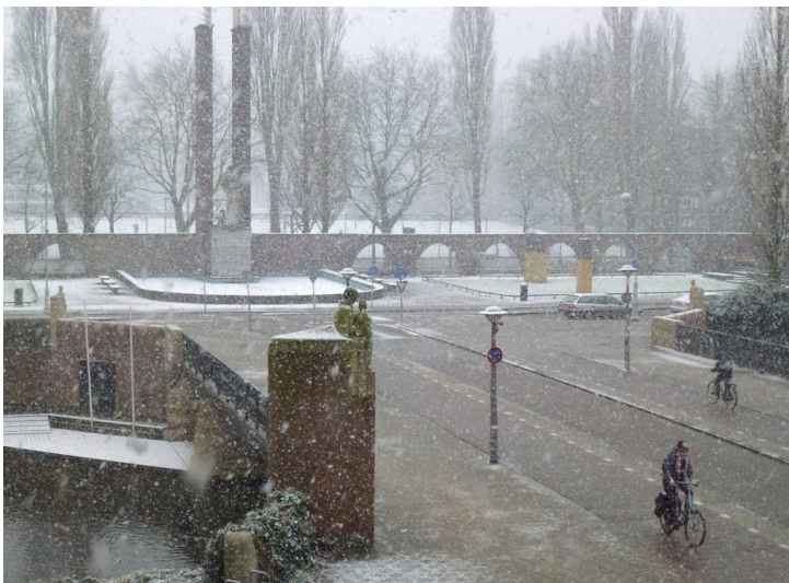
Waar ook de sneeuwstorm ons jaagt...