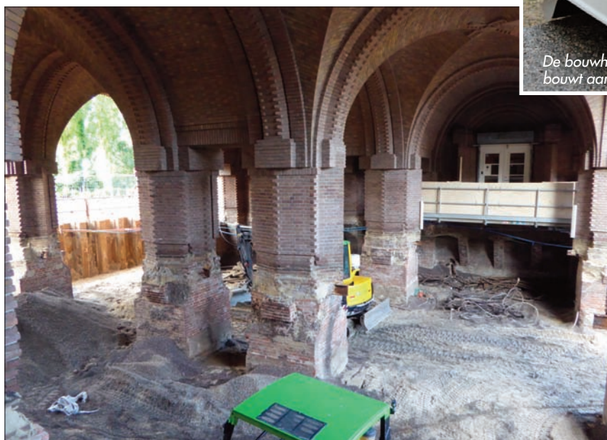
Tot de bodem weer dicht is, zijn de beide ingangen onder de poort bereikbaar via apart aangebrachte loopbruggen.