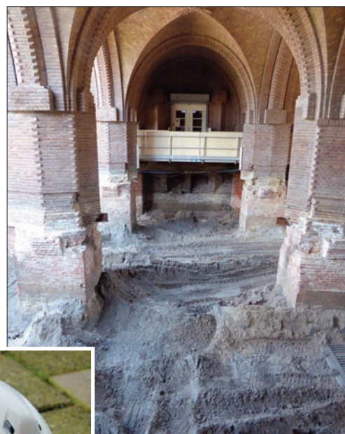
De onderste steen komt boven bij het graven onder de poort.