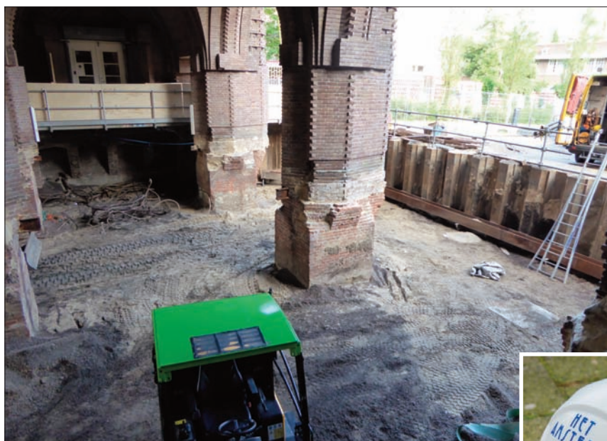
Damwanden onder de poort en een apart aangebrachte loopbrug voor de west loge.