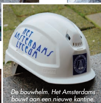
De bouwhelm. Het Amsterdams bouwt aan een nieuwe kantine.