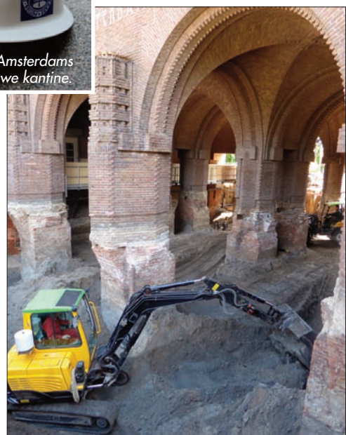
Graven onder de poort. Met kerst moet het klaar zijn!