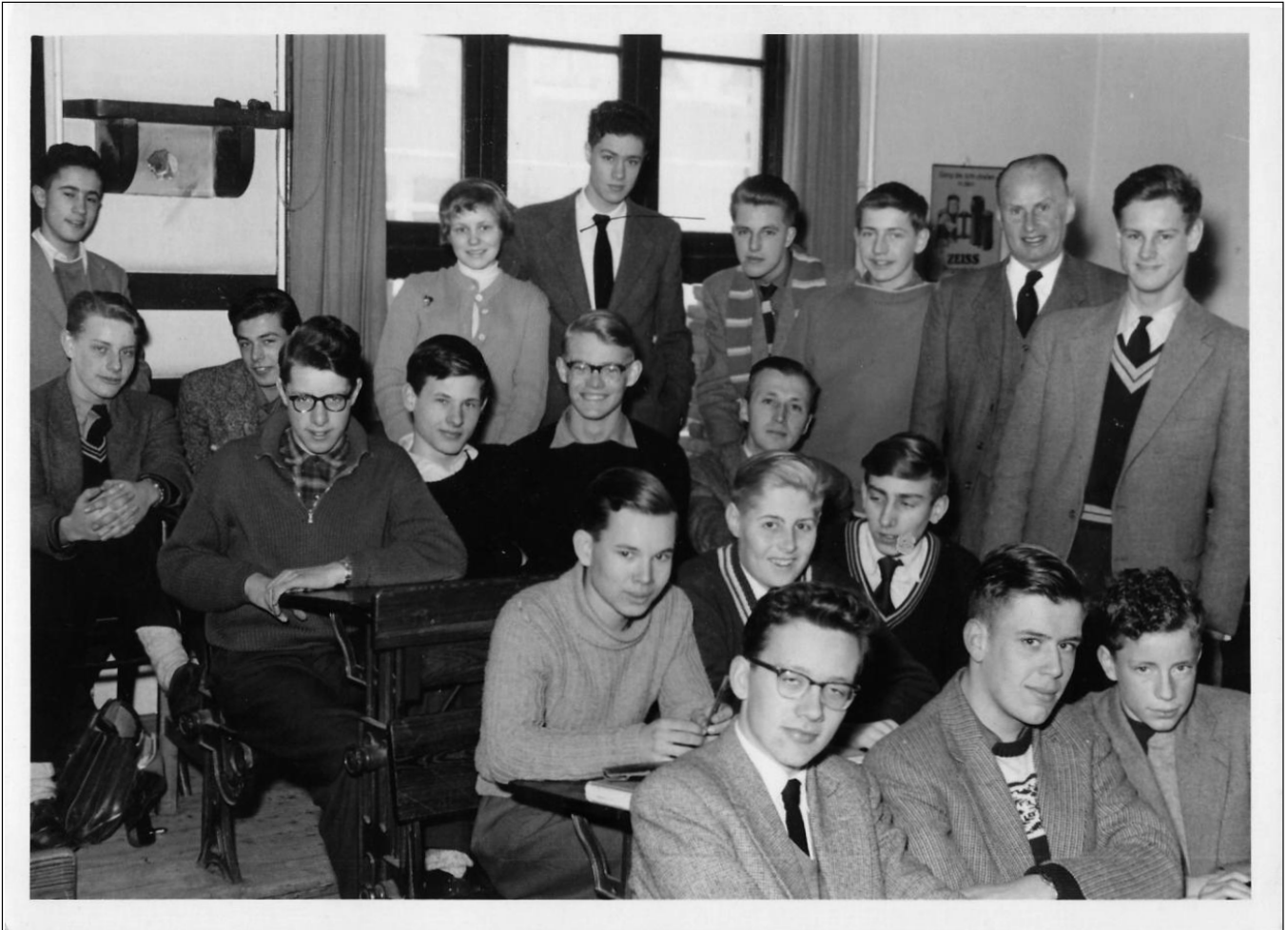
Klasse 4B, 1956