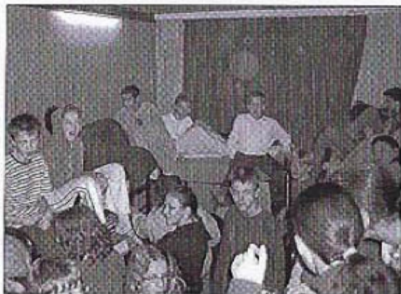
Veertig kinderen in één slaapzaal