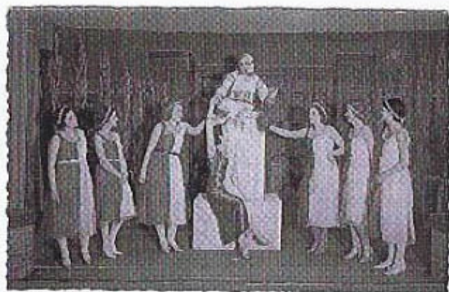
De Lycoumrevue 1932: