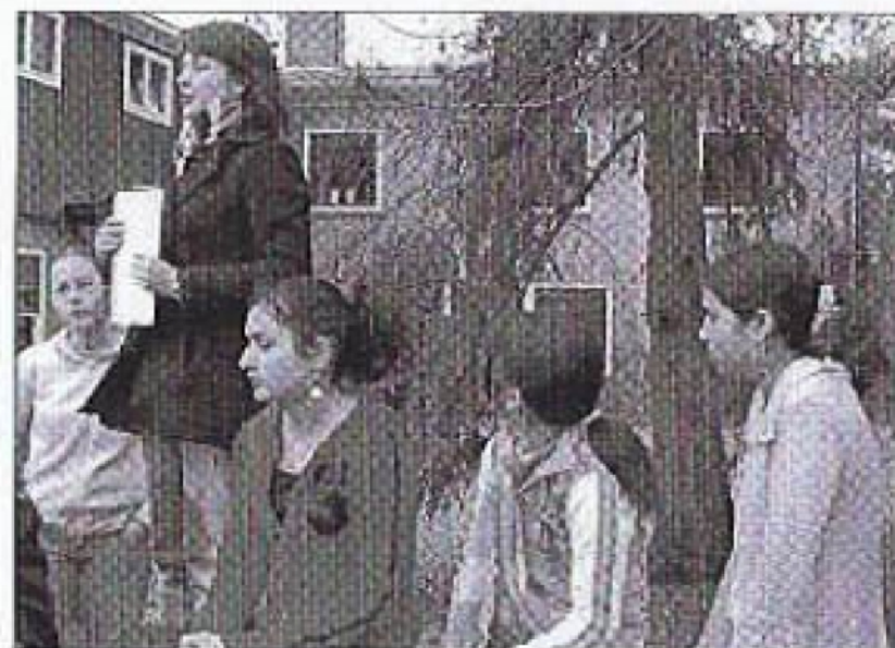
Juf spreekt de klas toe