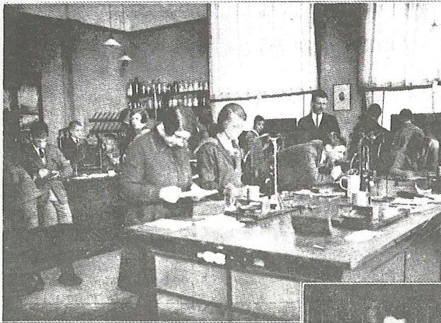
Het practicumlokaal natuurkunde

De school was schitterend ingericht en geoutilleerd: brede gangen, grote vierkante lokalen. In elke klas langs alle vier wanden op ca 2 m. hoogte een matzwart geschilderde schilderijlijst. Daarboven waren de muren wit geschuurd, evenals de plafonds. Onder de schilderijlijst waren de muren 'gesausd' (of dofgeverfd?), elke klas in een andere kleur, of liever: in 2 kleuren: een effen ondergrond en daarop spikkeltjespatronen in 'spatwerk', pointillé dus, b.v. terracotta op paarse ondergrond ('Tuschinskikleuren!'). Natuurlijke Historie, Natuur- en Scheikunde, hadden elk 2 lokalen: 1 klasselokaal en 1 practicum en elk een amanuensis: voor 'Natte His' Van Voorn, voor Natuurkunde Mühren en voor Scheikunde Polderman, alle drie erg aardig.